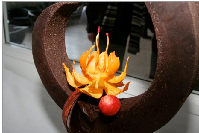
World Chocolate Masters Showpiece

Da det danske politi angiveligt stadig begrænser sig til citronhalvmånerne, håber jeg, at at behjertede læsere vil vide at bringe chokoladekagerne, dette banebrydende nye middel i efterforskningen til deres kendskab. Og der er ingen undskyldning for at lade være. Der bringes i bogen udførlige opskrifter på såvel cookies som andre kager, som er lige til at gå til på trods af de amerikanske mål. Bliver det regnvejr eller kan man ikke udholde spændingen, kan man så afbryde læsningen til fordel for en tur i køkkenet.