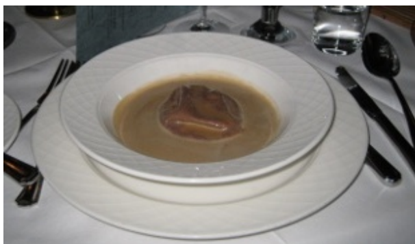
Figur 3 Første forret.

Vi fik først en lille appetitvækker i form af en østers presset ned i en lille hvid chokoladeterning. Kompakt og kødfuld, fin frisk havsmag med lidt kontrast af løg, malt og crunch. Ledsaget af et glas mousserende Saumur.