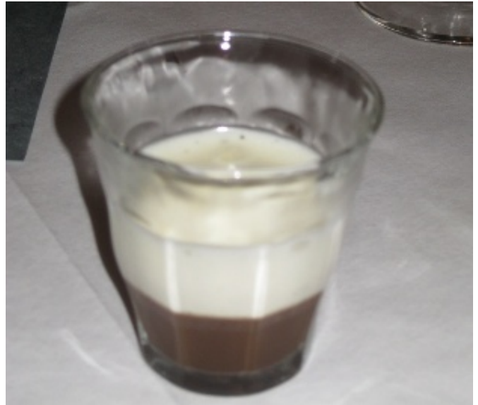
Figur 9 Kaffe og hvid chokolade på en ny måde.

Før hovedretten fik vi en ganerenser, der var en iscreme lavet på chokoladestout. I sig selv spændende med mange fine smagsnuancer, men måske netop for god og for smagfuld som ganerenser. Opskriften bringes nedenfor.