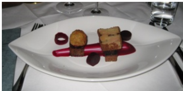
Figur 5 Næste ret.

Mens retterne blev serveret havde vi fornøjelsen af kokken, der fortalte om retten, chokoladen og hvad han synes var interessant ved retten.