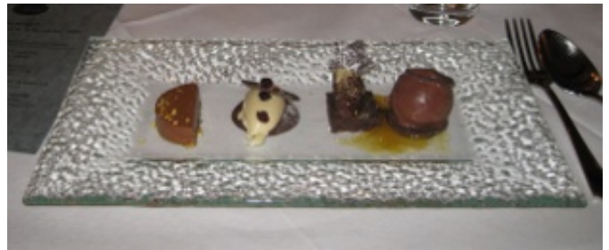
Figur 10 Desserten.

Hovedretten fik os igen til at juble. Tam og vild and, et stykke af hvert ledsaget af grønkålssalat, en kartoffelrøsti, en sauce grué og en helt forrygende mince pie med utallige spændende smagsoplevelser. Igen var anmelderne splittede om, hvorvidt den tamme eller den vilde var bedst. Vi nød begge dele, ligesom vi ikke sagde nej, da vi blev tilbudt mere af den chokoladetilsmagte sauce.