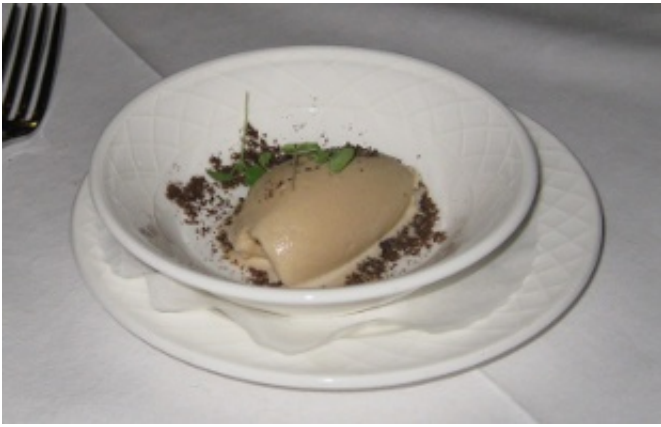
Figur 6 En lille overraskelse mellem menuerne

Før hovedretten fik vi en ganerenser, der var en iscreme lavet på chokoladestout. I sig selv spændende med mange fine smagsnuancer, men måske netop for god og for smagfuld som ganerenser. Opskriften bringes nedenfor.