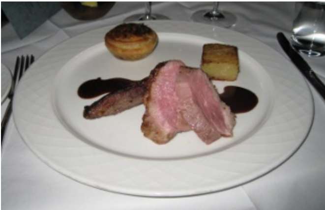
Figur 7 Hovedretten.

Før desserten blev der serveret en ret i glas. Nederst var en lækker kaffe og øverst Callebaut hvid chokolade sprøjtet med sifon, hvilket gav en meget let konsistens - meget smag i næsten ingenting. Kaffen var tilsat snaps og den hvide chokolade øverst kontrasterede den stærke kaffesmag udmærket. En god optakt til næste ret. Opskriften bringes nedenfor.