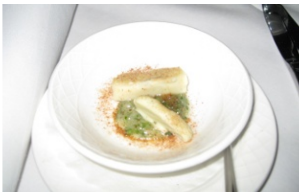
Figur 2 Østers og chokolade - hvad mere kan man bede om?

Allerede ved måltidets begyndelse blev vi budt på tre slags brød: Mumms eget maltbrød, gruyère brød og et særligt chokoladebrød, bagt med coeur de Guanaja 80 %. Brødbakken blev genopfyldt flere gange under middagen, så godt smagte det.