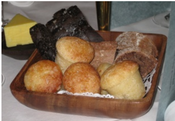
Figur 1 Mumms chokoladebrød (det mørke bagest) og det øvrige udvalg af brød serveret med Læsø saltet smør

Omgivelserne var hyggelige, selv om det kom en anelse bag på os, at vi var placeret ved små borde, hvor det blev svært at diskutere oplevelsen med andre end de to-tre andre ved samme bord. Stemningen var dog fin og betjeningen venlig og vidende, så det blev en god aften.