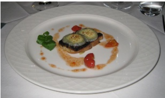
Figur 8 Den obligatoriske osteret tilsat chokolade.

Herefter var der osten med et glas Riesling. En Bruchetta med gedeost, oliven-chokolade-tapenade og hybensylt (hed det ikke i gamle dage syltetøj?). Fin lille ret, hvor olivensmagen dog måske dominerede lidt i forhold til ost og chokolade. Men hver sin smag.